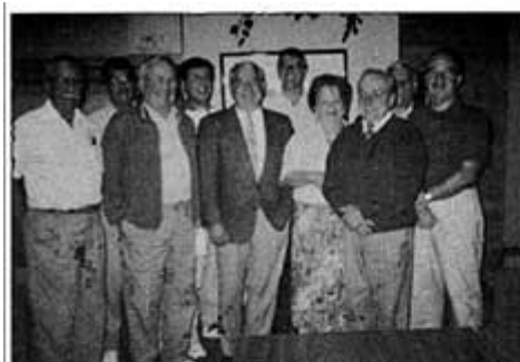
1er septembre 1993. Conseil du chapitre du Saguenay-Lac St-Jean.