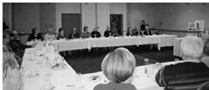
Participants à la rencontre.

Les membres du comité exécutif de l'association se sont rendus, malgré la température inclemente, à l'hôtel Holiday Inn de Jonquière, le 30 novembre 2003, pour rencontrer les cousins-cousines Gagnon et Belzine de la région et du chapitre Saguenay / Lac St-Jean.